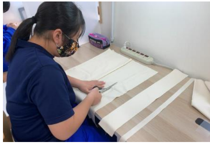
エコバッグ作製のための布の裁断