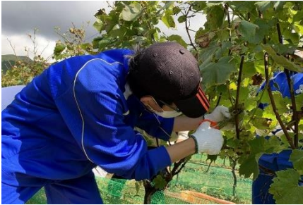
ワイン用のぶどうの収穫