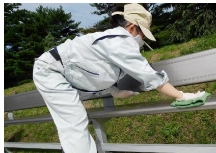
隅々までしっかり雑巾掛け