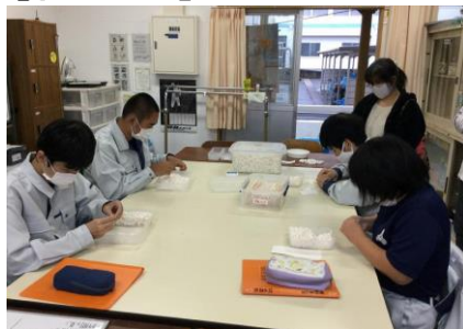
黙々と取り組んでいます