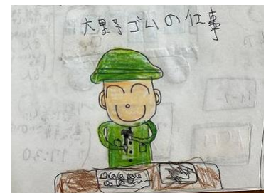
実習で取り組んだことを絵に描いてしっかり記録している生徒もいました。