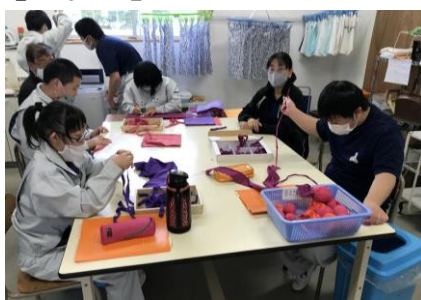
印付け→布裂きの順番で流れ作業