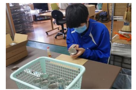
缶詰のラベル貼り