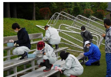
全員で協力して作業します