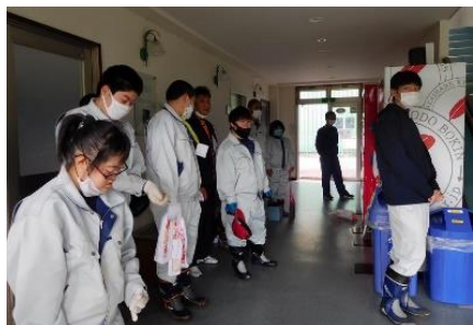
球技場に入る前の挨拶