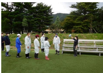
指示内容はしっかり確認