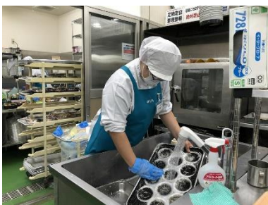
目玉焼き器の洗い