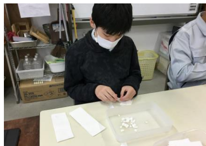
細かくちぎることがポイント