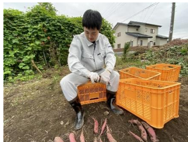
さつまいもの収穫